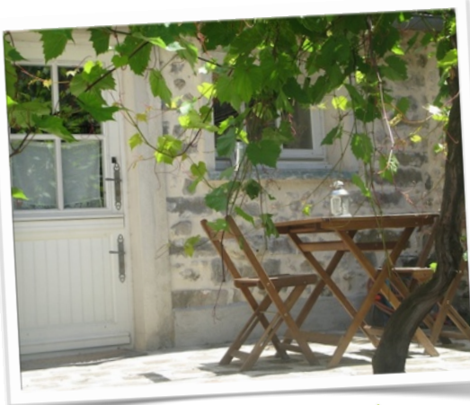
La p'tite maison des Roches Gîte calme&nature

C'est au n°5, au bout du chemin la dernière maison à gauche.